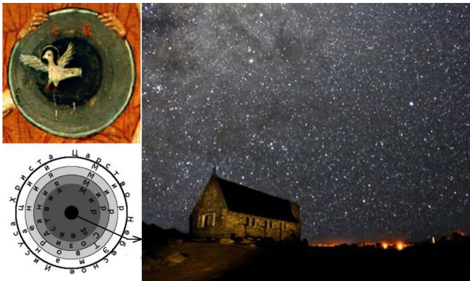
Рисунок 1.1.2. Мироздание Иисуса Христа

Когда же появился человек телесный в том виде, в каком мы привыкли наблюдать себя и других существ, похожих по форме на нас и называемых людьми?