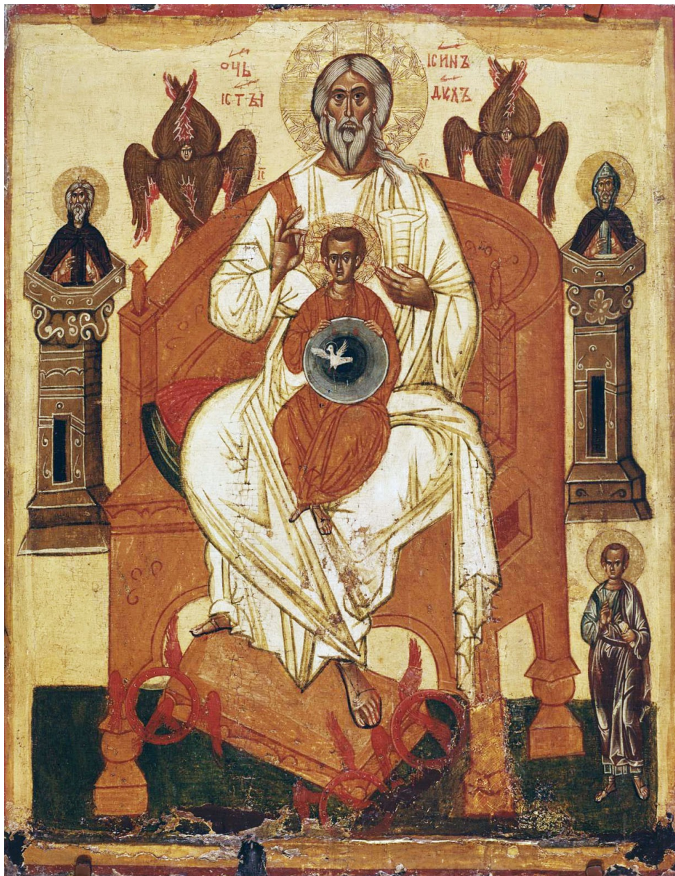
Рисунок 1.1.1. Отечество